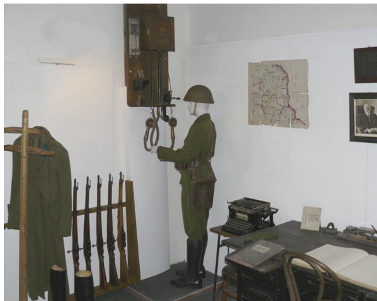
UKÁZKA INTERIÉRU ODDĚLENÍ FINANČNÍ STRÁŽE 30. LÉTA 20. STOLETÍ

U TELEFONU STOJÍ RESPICIENT FINANČNÍ STRÁŽE VE STEJNOKROJI DLE VLÁDNÍHO NAŘÍZENÍ 106/1938 Sb. S VOJENSKOU PŘILBOU VZ. 32 JAKO PŘÍSLUŠNÍK SOS